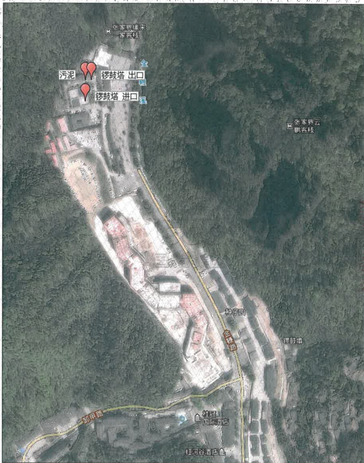
附图 1 点位示意图