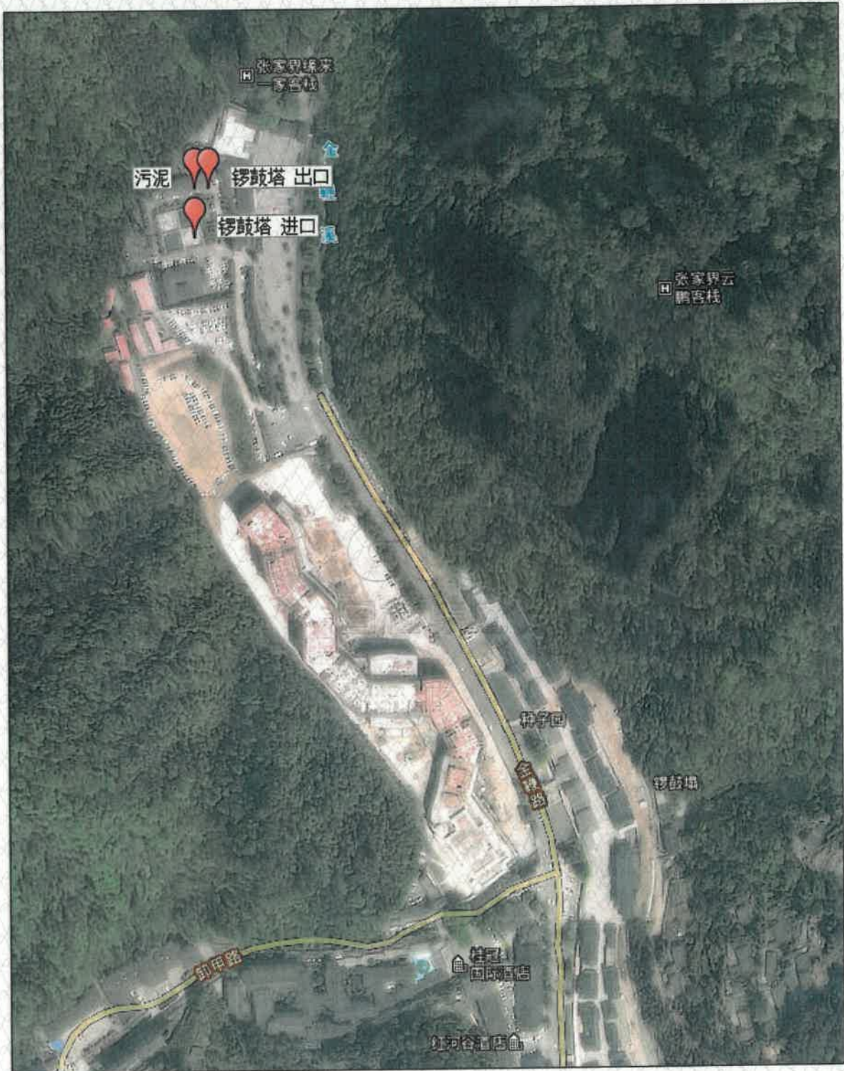
附图 1 点位示意图