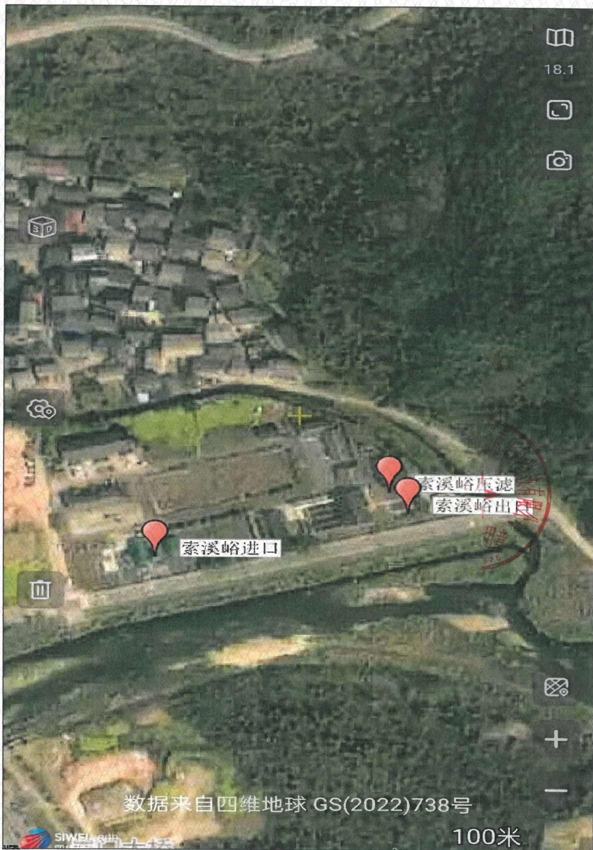
附图 1 点位示意图