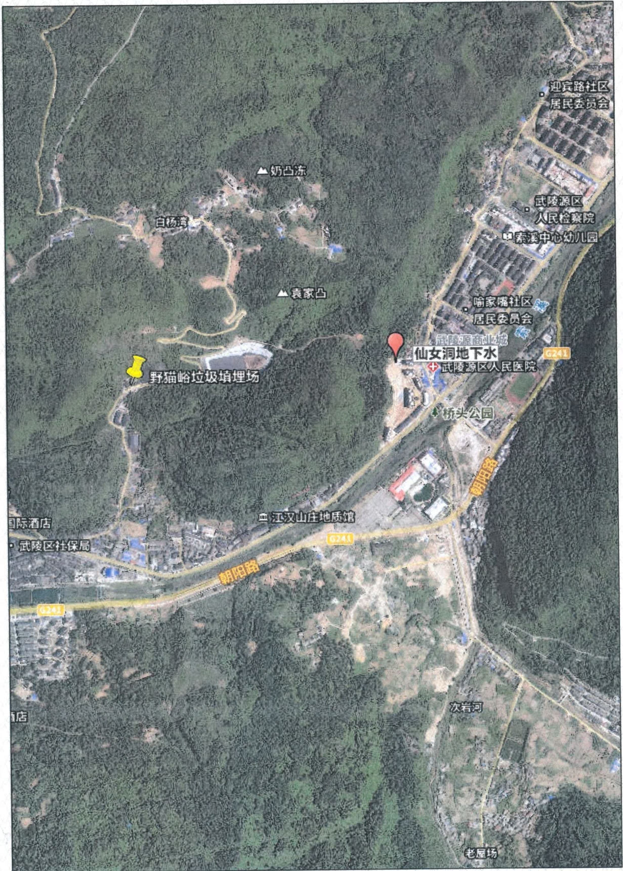
附图 1 点位示意图