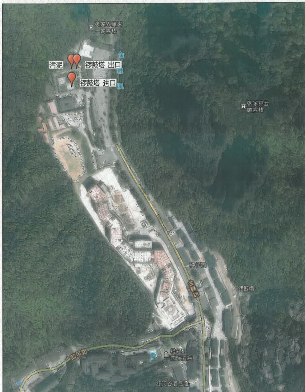
附图 1 点位示意图