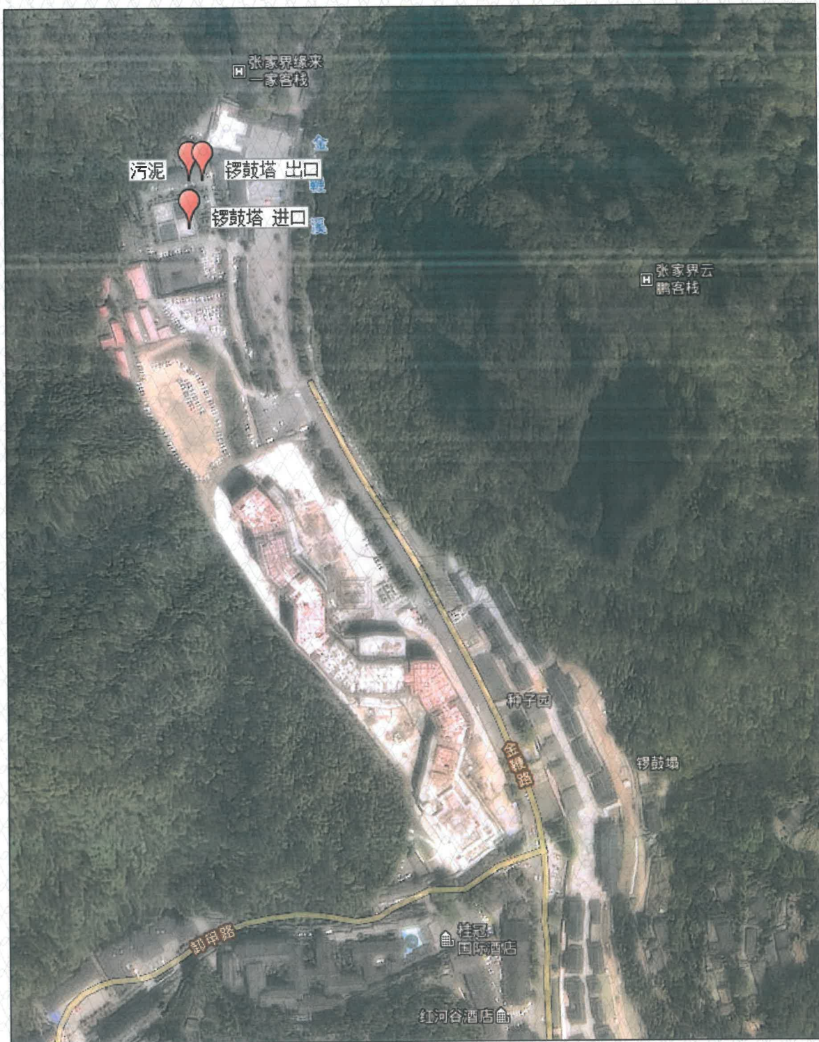
附图 1 点位示意图