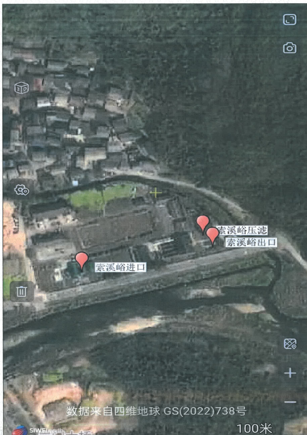
附图 1 点位示意图