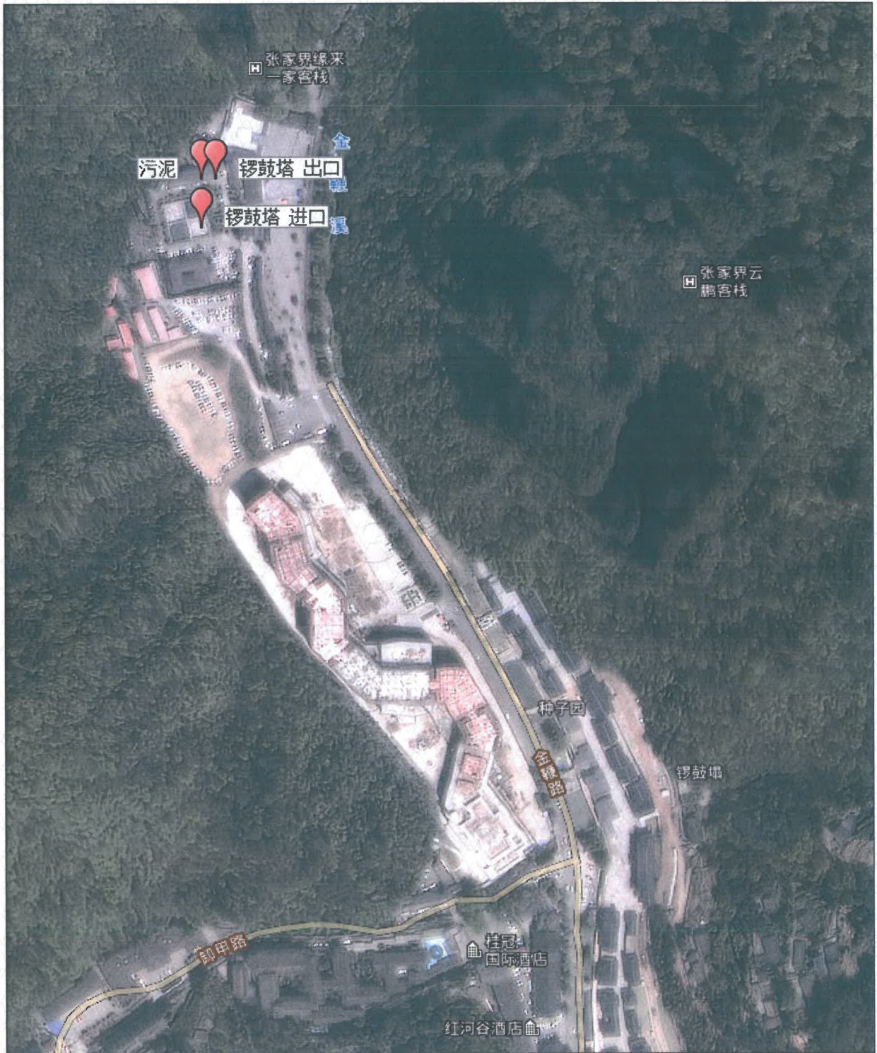
附图 1 点位示意图