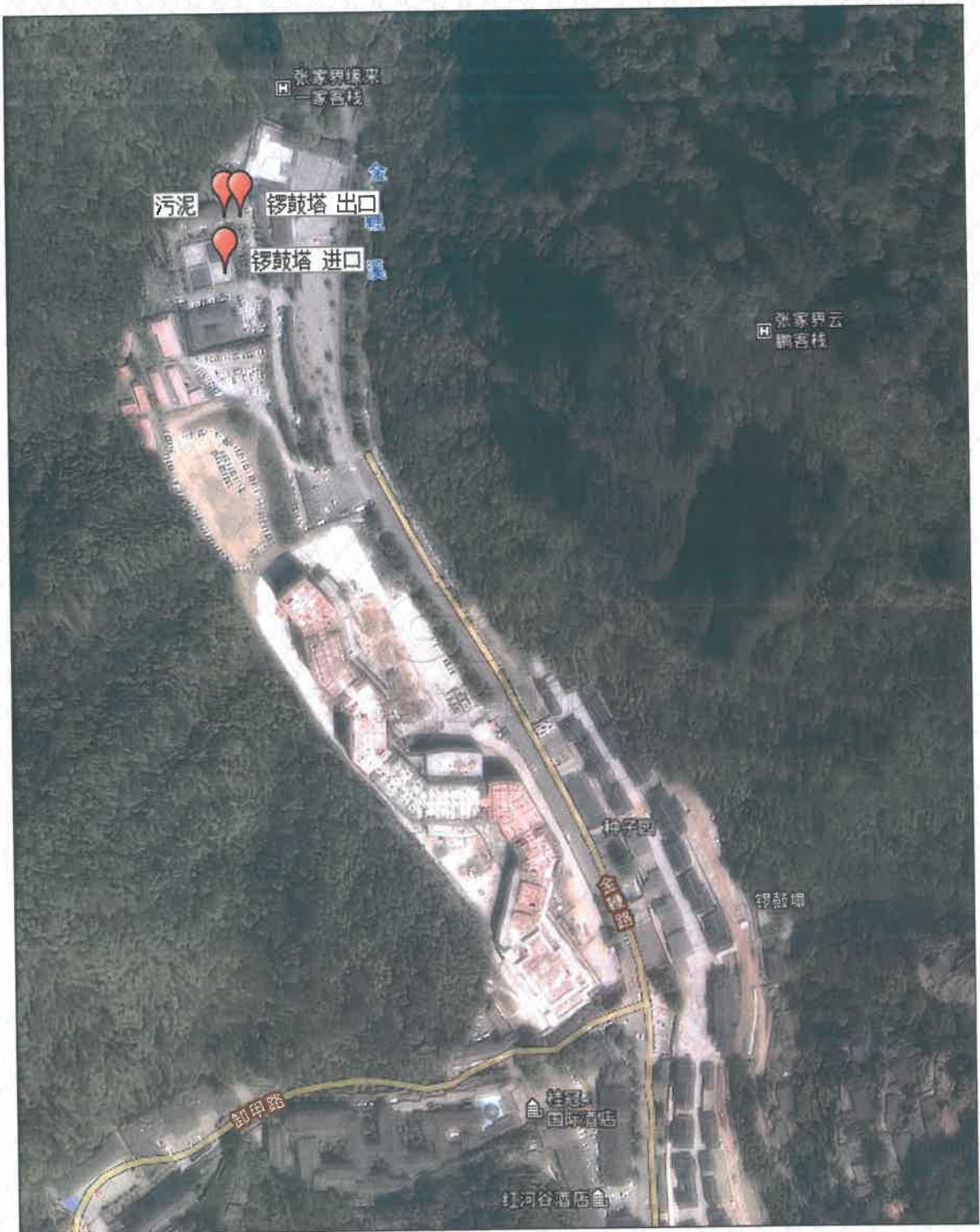
附图 1 点位示意图