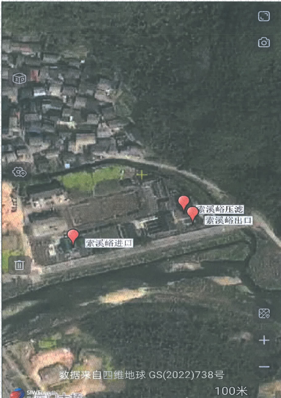
附图 1 点位示意图