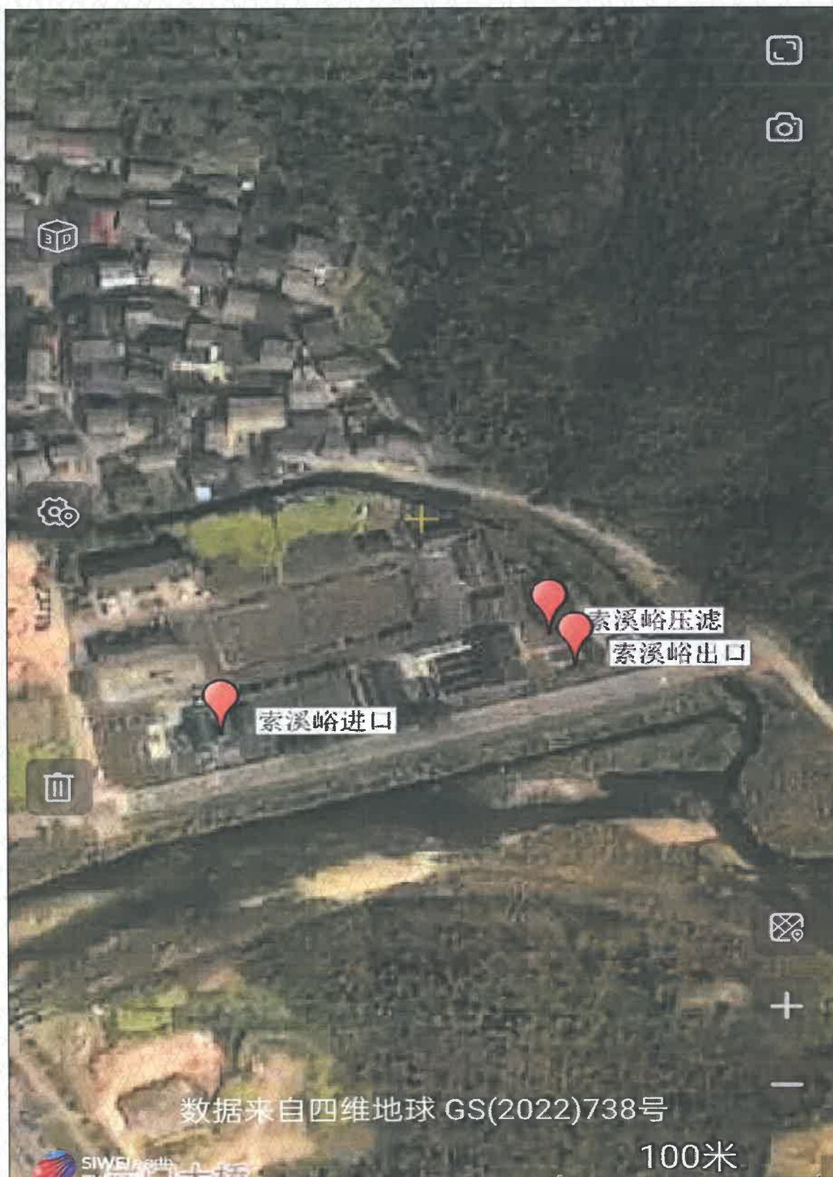
附图 1 点位示意图