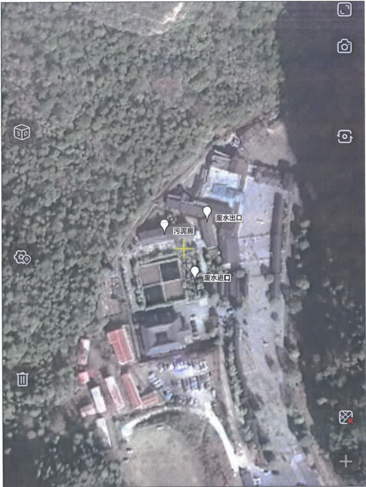
附图 1 点位示意图