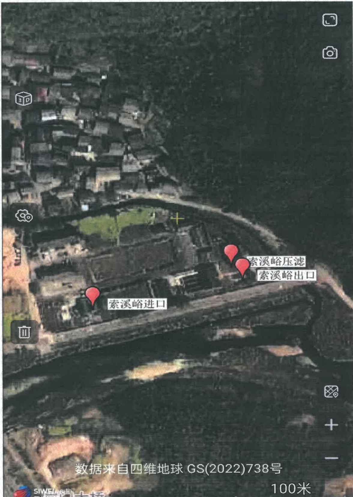
附图 1 点位示意图