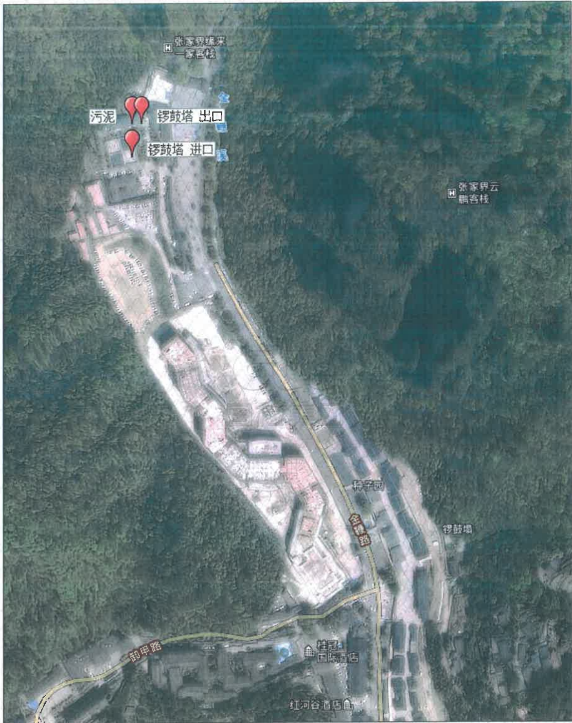
附图 1 点位示意图