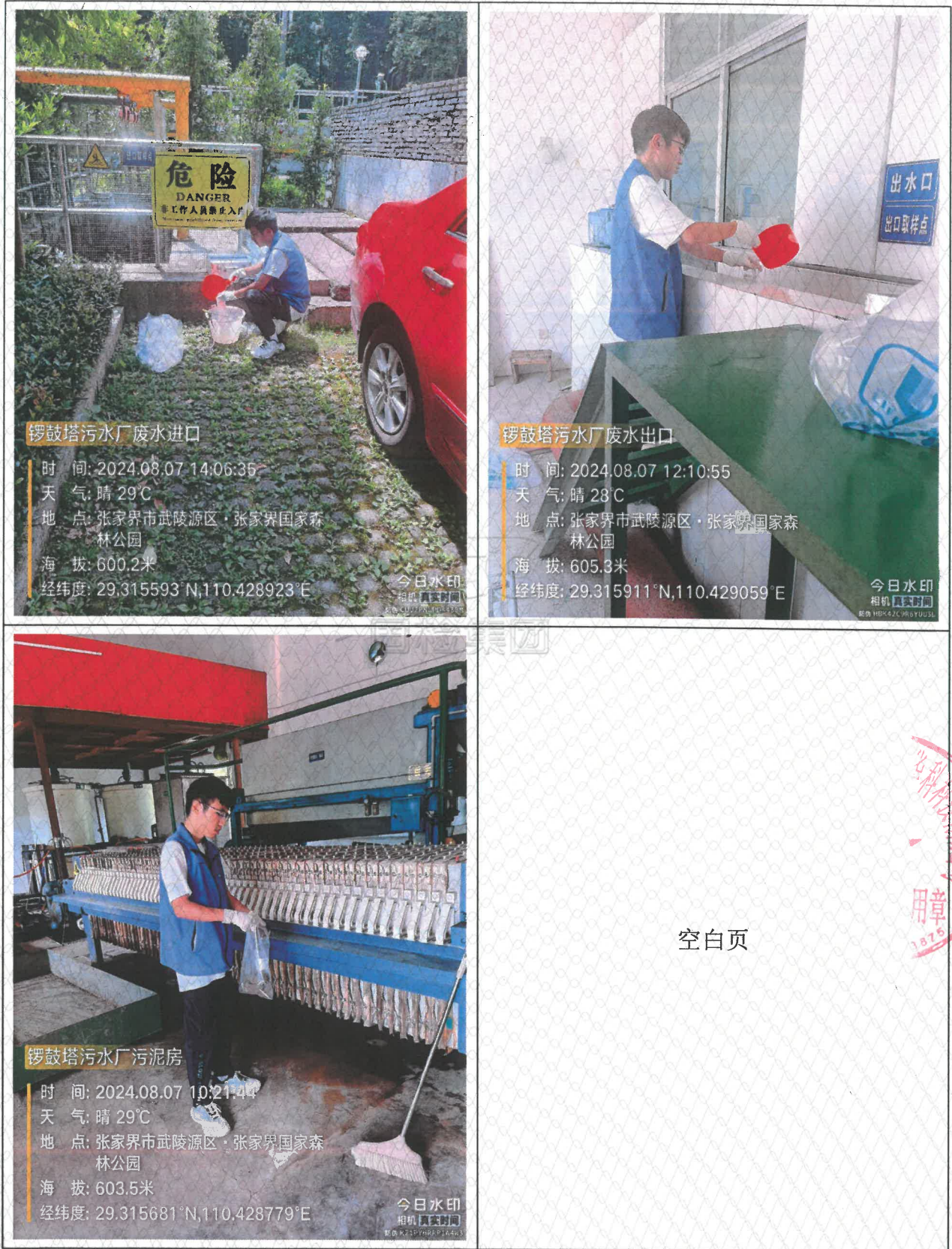
附图 2 部分现场采样照片