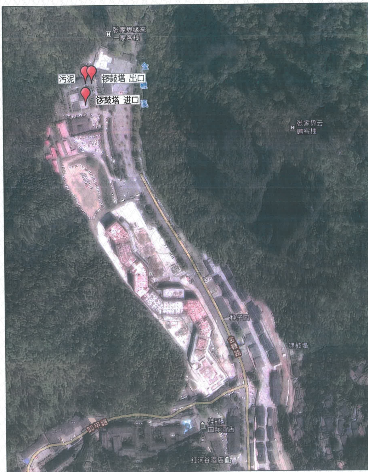
附图 1 点位示意图