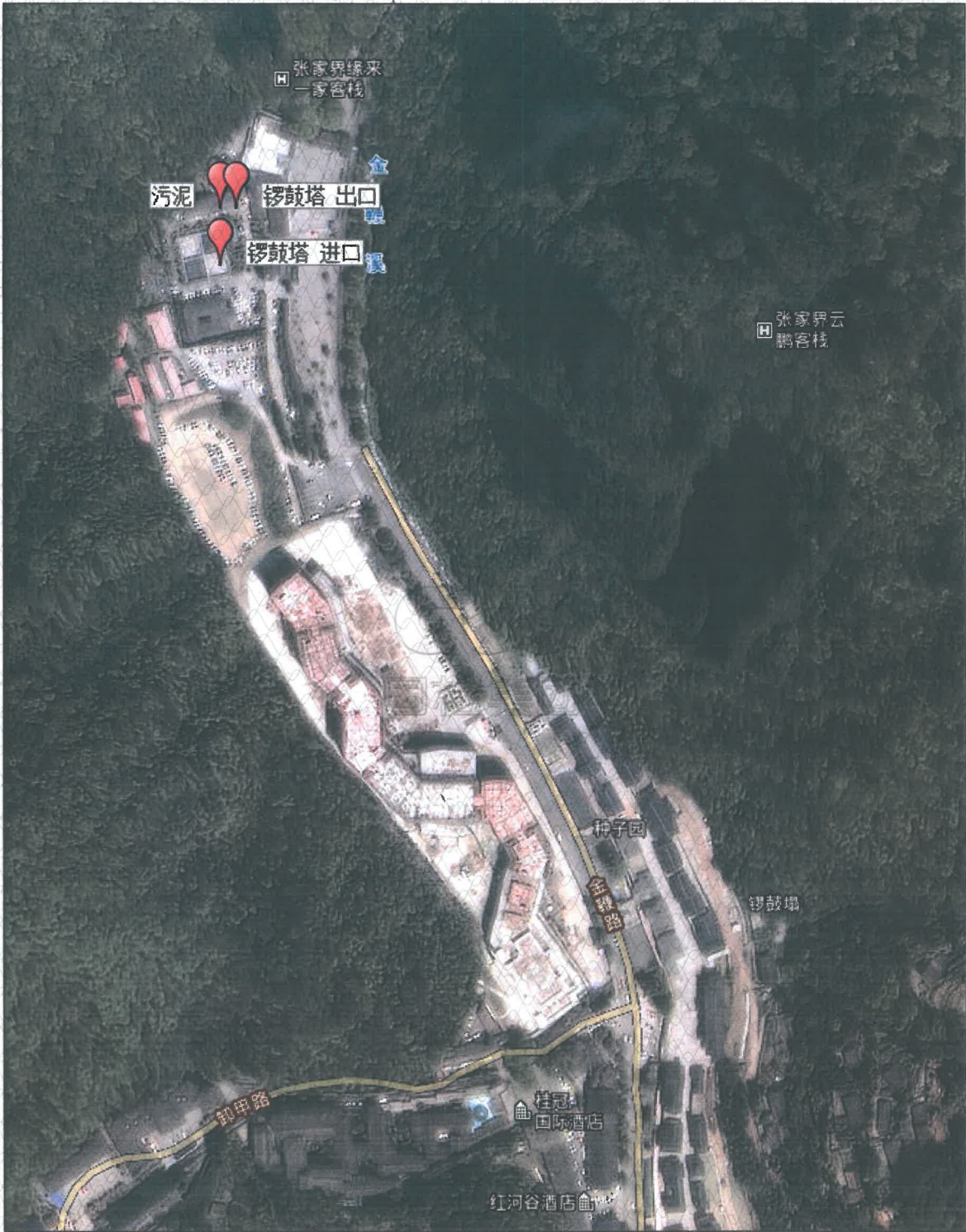
附图 1 点位示意图