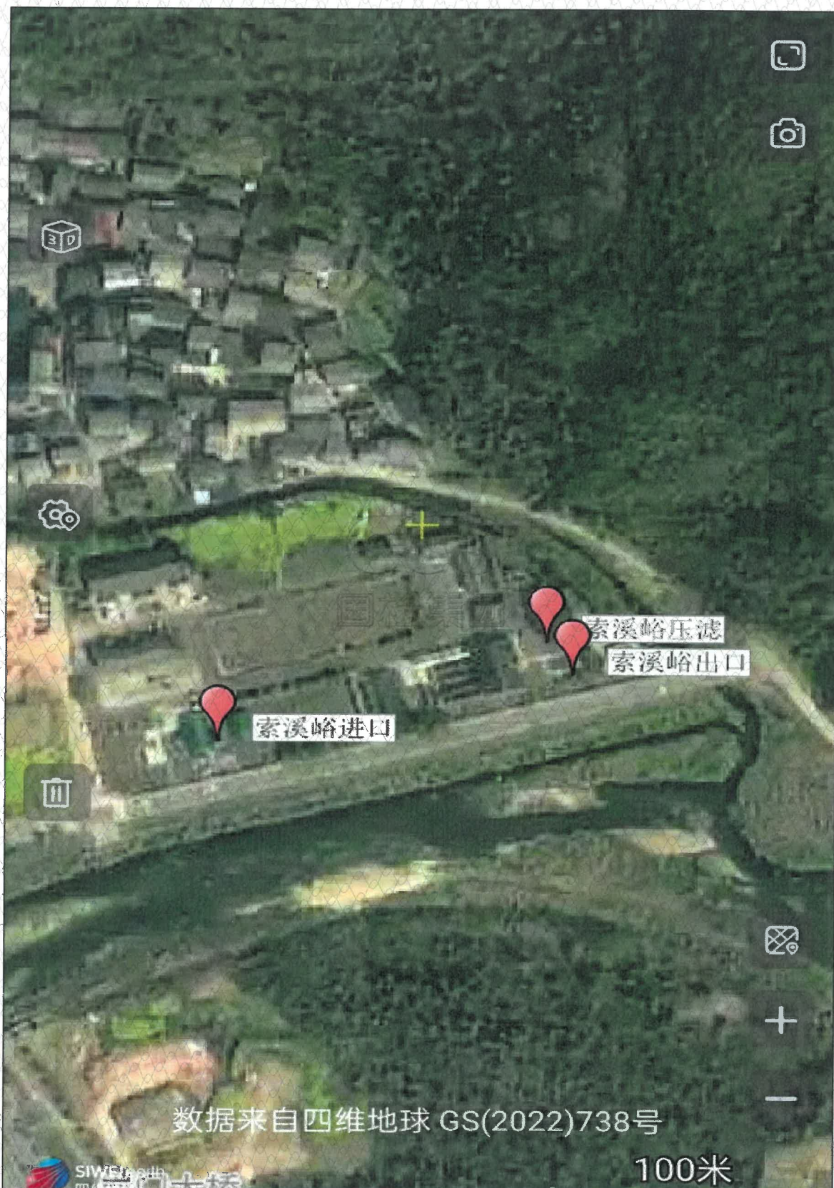
附图 1 点位示意图